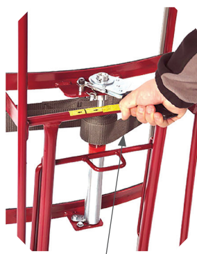
Sangle de maintien avec tendeur