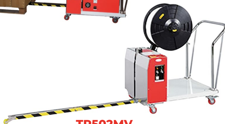
TP502MV SUR SECTEUR 220 V