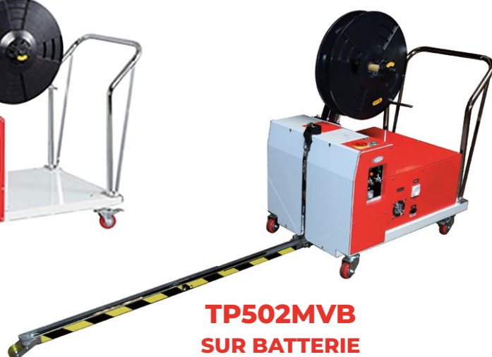
TP502MVB SUR BATTERIE