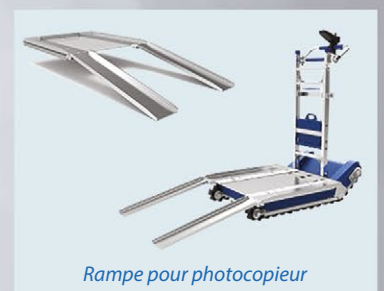
Rampe pour photocopieur