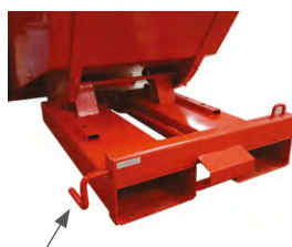
Déclenchement manuel ou réalisé directement du chariot élévateur à l'aide d'une chaîne ou d'un câble