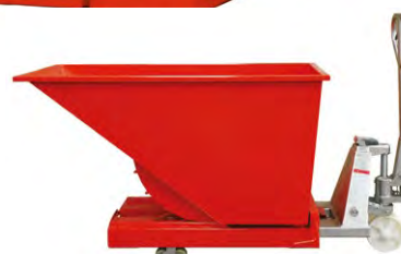
Déplacement manuel avec transpalette jusqu'à 1600 l