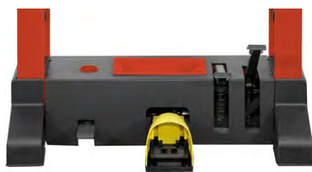
Fonctionnement par pédales