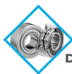
ROULEMENTS À BILLES DOUBLE ÉTANCHÉITÉ