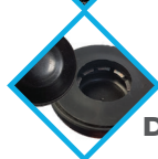
SYSTÈME DE BLOCAGE DE ROUE RENFORCÉ