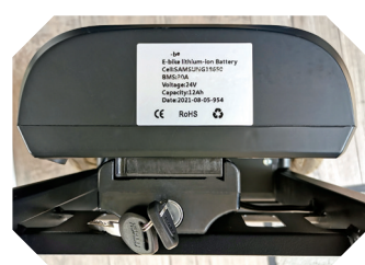
Batterie lithium-ion amovible avec vérouillage à clé