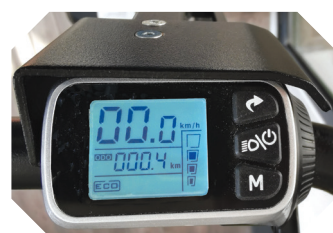
Affichage de contrôle sur la poignée