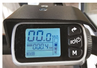
Affichage de contrôle sur la poignée