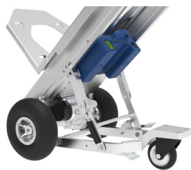
Roue auxiliaire rabattable