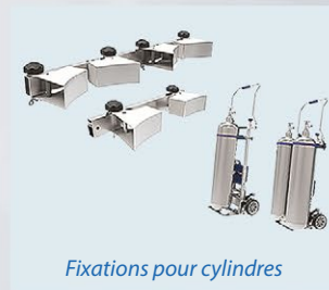
Fixations pour cylindres