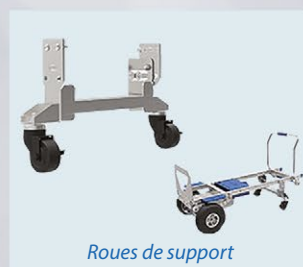
Roues de support