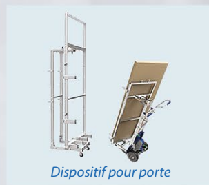
Dispositif pour porte