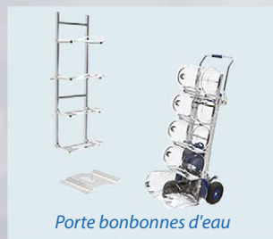
Porte bonbonnes d'eau