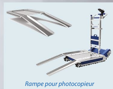
Rampe pour photocopieur