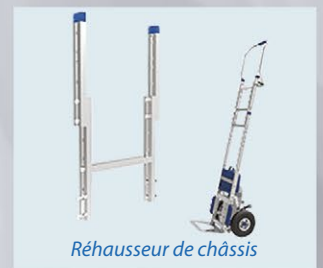
Réhausseur de châssis