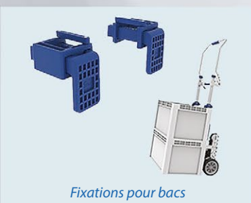
Fixations pour bacs