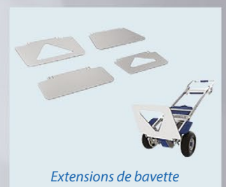
Extensions de bavette