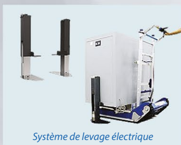
Système de levage électrique