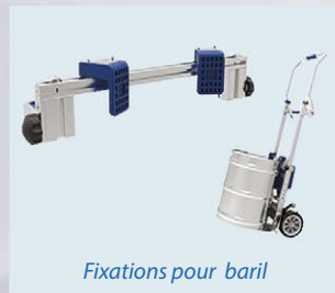
Fixations pour baril