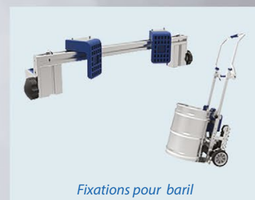
Fixations pour baril