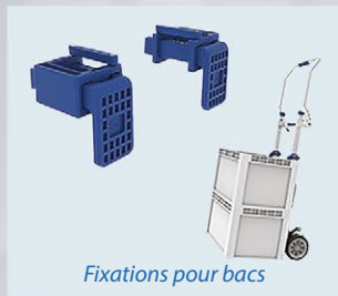
Fixations pour bacs