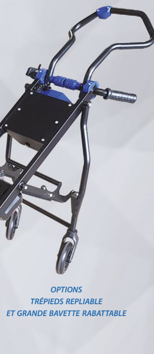
OPTIONS TRÉPIEDS REPLIABLE ET GRANDE BAVETTE RABATTABLE

DÉPLACEMENT MOTORISÉ SUR LE DONKEY LIGHT XX