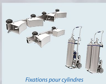
Fixations pour cylindres